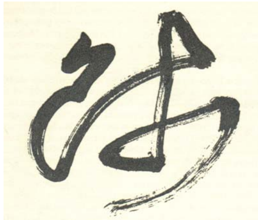
Figura 5: Shi – il Maestro