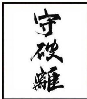
Figura 3: Shu Ha Ri

E' possibile la reazione spontanea davanti a qualunque attacco, con assoluta efficienza del corpo e della tecnica. Qualcosa ha reagito. Qualcosa ha lottato con successo ed è riuscito. Qualcosa si realizza in una consapevolezza cognitiva, nella mente “piena di vuoto”, un vuoto non inteso come assenza ma disponibilità e apertura mentale, liberi di usare concetti e distinzioni senza essere usati da loro.