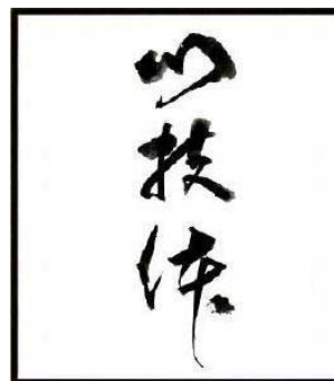
Figura 4: Shin Gi Tai